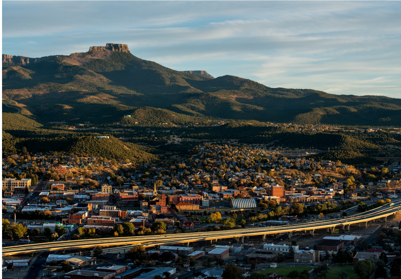
全新佔地19,200英畝的Fishers Peak州立公園，俯美國科羅拉多州千里達，在這裡全新的娛樂休閒活動商機，將會是刺激當地經濟的利好消息。