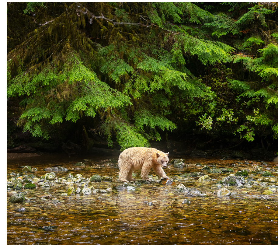
來自貝佐斯地球基金的資金，將會幫助保證這片年代久遠、佔地25萬英畝的森林得到長期保護，並支持整個Emerald Edge的氣候工作。這裡是這隻英屬哥倫比亞靈熊等野生動物的棲息地。

解決方案： 與原住民合作，保存沿岸雨林，實現由原住民領導管理森林的願景，同時保護作為碳儲存庫的雨林。