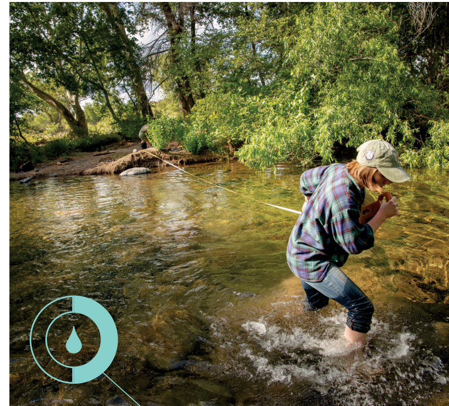
兩側種著楊柳與三角葉楊，美國亞利桑納州的弗德河在沙漠中開墾出一條翠綠的水道。